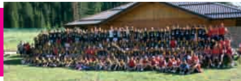
Sport & Holidays - summer and winter camp - ringrazia per l'ospitalità: